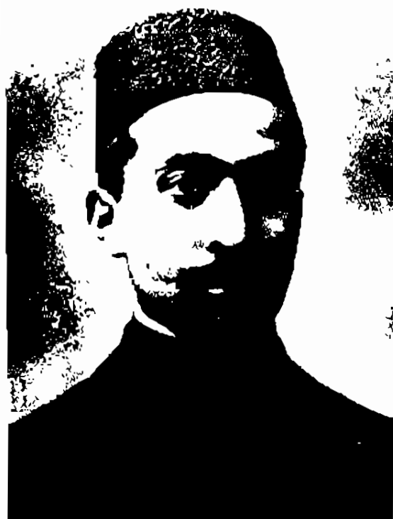
جعفر خامنه ای