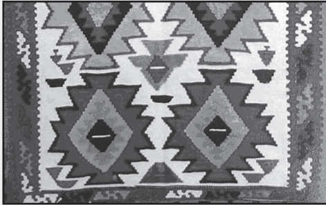
تصویر شماره ۵ قسمتی از گلیم با نقش آینه گل

از دیگر نقوش طبیعی - که مفهومی تجربیدی یافته - نقش شاخ بز است. این نقش، شباهت زیادی به سر بز با شاخ‌های تیزش دارد. نقش شاخ بز، از نقوش ابتکاری است و به صورت نادری بافته می‌شود. طرح مذکور، به گونه‌ای در کنار هم قرار گرفته است که اشکال لوزی و شش‌گوش را در فضاهای خالی مابین فضاهای منفی ایجاد کرده است و فضای کل گلیم را در طول و عرض با آن پر کرده است.