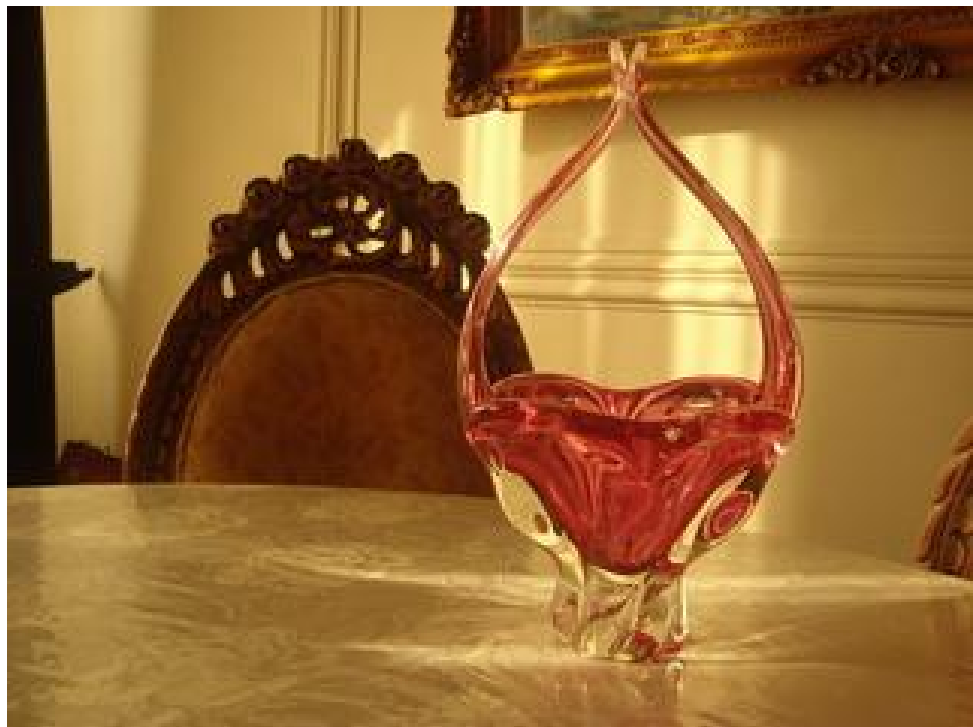
این عکس را با تراز سفیدی ابری گرفتم. نتیجه کار عکسی شد که با تراز سفیدی اتوماتیک این گرما را نداشت.

در عکاسی داخل منزل و مخصوصا در موقع عکس گرفتن از سوژه های غیر زنده حالت تراز سفیدی دوربین را از اتوماتیک به ابری تغییر دهید. در این حالت تصویر شما با رنگهای گرمتری گرفته می شود و نتیجه کار عکس جذابتر و با رنگ و لعاب تری خواهد شد. البته تغییر رنگ محیط در این مورد هم اتفاق خواهد افتاد ( چون ما در منزل قطعا ابری نخواهیم داشت و در واقع در حال گول زدن دوربین هستیم) ولی ما در اینجا از این تغییر رنگ به نفع زیبا شدن عکسمان بهره می بریم. عکاسی هنر تجربه هاست و این ترفند کوچک هم یکی از تجربه های عکاسی است.